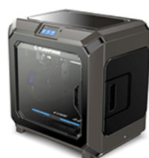
STAMPATE 3D SHAREBOT CREATOR 3 PRO