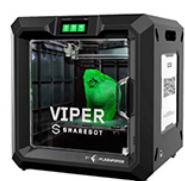
STAMPATE 3D SHAREBOT VIPER