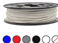
2 BOBINE PLA 750Gr