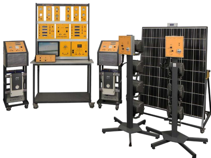
DL SUNWIND24V2 DL SUNWIND12V2

L'obiettivo principale di un sistema di alimentazione ibrido è quello di combinare più fonti allo scopo di produrre energia elettrica non intermittente, sfruttando le molteplici energie rinnovabili disponibili.